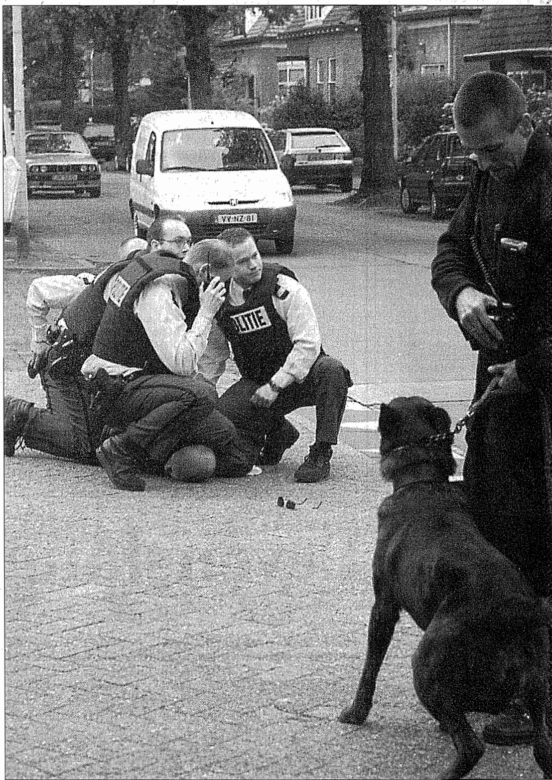
□ Volkert van der G. wordt gearresteerd na de dodelijke schietpartij op Pim Fortuyn.