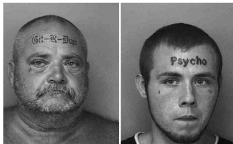
Figuur 1: Personen van wie eenvoudig een eenduidig signalement kan worden gegeven

kan zelfs uiterst specifiek zijn, zoals het signalement van de mannen in figuur 1. Ook het tegenovergestelde kan voorkomen: als alle getuigen het erover eens zijn dat de dader een blanke man was, heeft het weinig zin iemand van Surinaamse afkomst aan te houden en te vervolgen. In dit hoofdstuk bespreken wij in welke mate het opnemen en het verdere gebruik van signalementen een zinvolle bezigheid is.