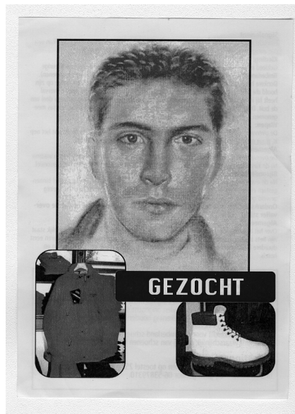
Figuur 3: Compositietekening in Amsterdams Bunzing-onderzoek

Het probleem met zowel politietekeningen als compositiefoto's is dat de kwaliteit daarvan niet alleen afhangt van de kwaliteit van de herinnering van de getuige aan het uiterlijk van de dader, maar ook van zijn mogelijkheden dat uiterlijk te verbaliseren en van de kwaliteit van de tekenaar of degene die de computer bedient en ook nog eens van de interactie tussen getuige en de politieambtenaar. Onze ervaring is dat het als getuige bijzonder lastig is om met een tekenaar waarmee het niet klikt samen een tekening te maken. Onder omstandigheden kan zo'n tekening echter de oplossing van een zaak betekenen. In Amsterdam had een overvalder inmiddels 43 winkels beroofd. In die zaak, waarbij de eerste auteur zijdelings betrokken was, 59 werd met behulp van een aantal getuigen een politietekening gemaakt en werden afdrucken aan surveillerende agenten meegegeven (zie figuur 3).